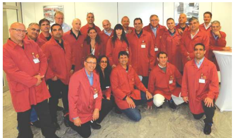
ביקור ב-Avnet Logistics חברי הקבוצה בחלוקים והארקה "אנטי-סטטית"

וטעינה והיא מטפלת כיום בכ-2000 שורות קבלה וכ-5,000 שורות ליקוט ביום עם אפשרות הרחבת כמות ותפוקות בעתיד.