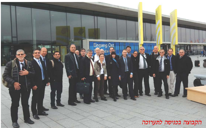
הקבוצה בכניסה לתערוכה

Industry 4.0, the Internet of Things and e-commerce