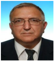
מאת יצחק דנה