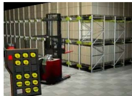
המלגזה מפעילה את ה-Satellite

וכך הלאה בקצב תפוקות גבוה. למעשה אנו משתמשים כאן במערכת אחסון חצי אוטומטית ובמחירים סבירים.