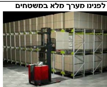
המלגזה לוקחת משטח תורן