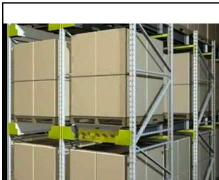
המלגזה מניחה את ה-Satellite

התפוקות ניתן להשתמש בשני מלגוזות ( אחת בכל צד) ולשמור על קצב תפוקות גבוה ורענון תמידי של המשטחים בכל נתיב. להלן "סרטון" הממחיש את תפעול המערכת ב LIFO: