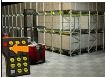
המלגזה נוסעת וה-Satellite מופעל